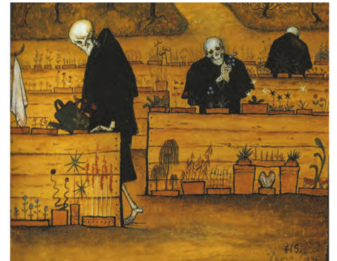
Jardin de la mort (1888) de Hugo Simberg au Musée Ateneum à Helsinki.